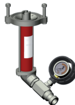
613021 B4-2 (rechtsdraaiend)