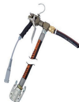
420058 Zargomat pro