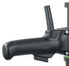
EHR 23/ 2.3 GS met serienummer vanaf 2020 0601