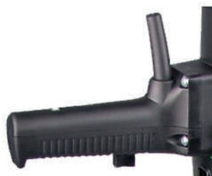
EHR 23/ 2.3 GS met serienummer t/m 2020 0600